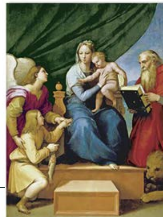
FT18-02 Sagrada Familia con Rafael, Tobías y San Jerónimo Autor: Rafael Museo del Prado, Madrid 13x21 cm 1,2€ unidad (sobre incluido)

I.V.A incluido. Gastos de envío no incluidos Realiza tu pedido enviando un e-mail a juan.naranjo@theodora.org Imágenes disponibles en formato digital - Consultar costes de personalización