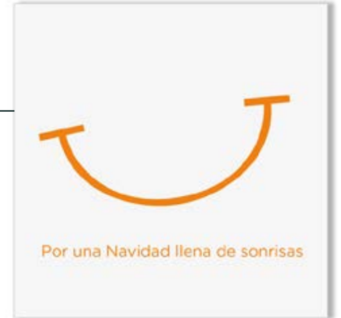
FT18-05 Autor: Fundación Theodora 15x15 cm 1,2€ unidad (sobre incluido)

I.V.A incluido. Gastos de envío no incluidos Realiza tu pedido enviando un e-mail a juan.naranjo@theodora.org Imágenes disponibles en formato digital - Consultar costes de personalización