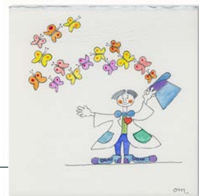
FT18-04 Autor: Osvaldo Maggi 15x15 cm 1,2€ unidad (sobre incluido)

I.V.A incluido. Gastos de envío no incluidos Realiza tu pedido enviando un e-mail a juan.naranjo@theodora.org Imágenes disponibles en formato digital - Consultar costes de personalización