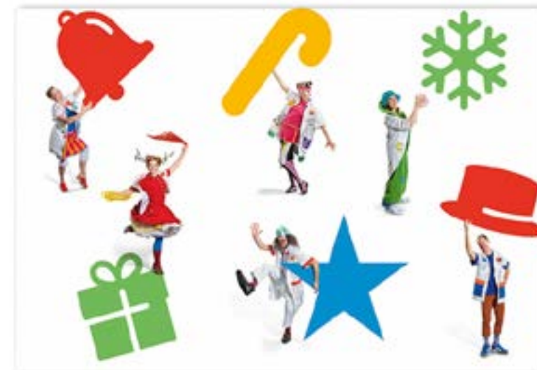
FT18-06 Autor: Fundación Theodora 21x15 cm 1,2€ unidad (sobre incluido)

I.V.A incluido. Gastos de envío no incluidos Realiza tu pedido enviando un e-mail a juan.naranjo@theodora.org Imágenes disponibles en formato digital - Consultar costes de personalización