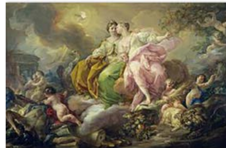
FT18-01 La Justicia y la Paz Autor: Corrado Giaquinto Museo del Prado, Madrid 21x13 cm 1,2€ unidad (sobre incluido)