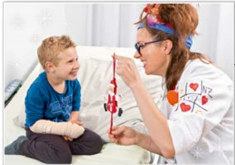
FT18-07 Autor: Fundación Theodora 21x15 cm 1,2€ unidad (sobre incluido)