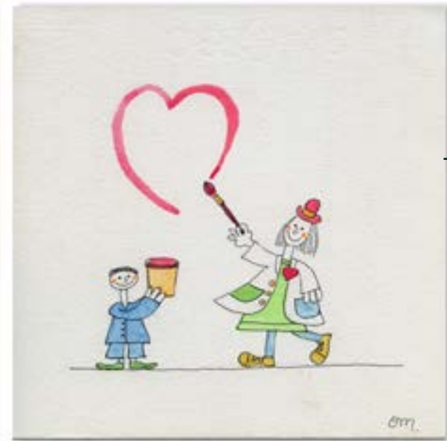
FT18-03 Autor: Osvaldo Maggi 15x15 cm 1,2€ unidad (sobre incluido)