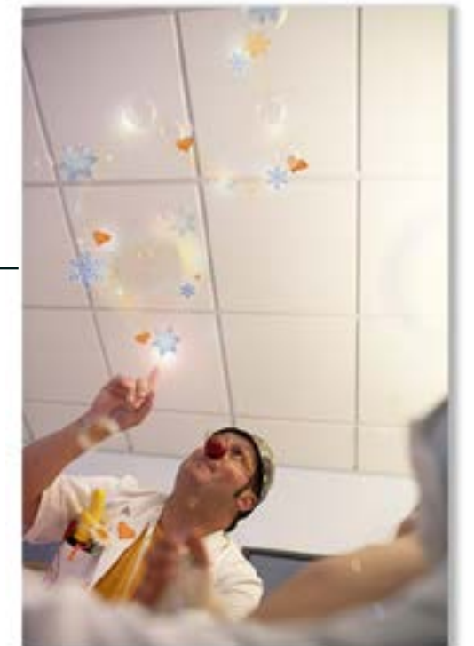
FT18-09 Autor: Fundación Theodora 14x21 cm 1,2€ unidad (sobre incluido)

I.V.A incluido. Gastos de envío no incluidos Realiza tu pedido enviando un e-mail a juan.naranjo@theodora.org Imágenes disponibles en formato digital - Consultar costes de personalización