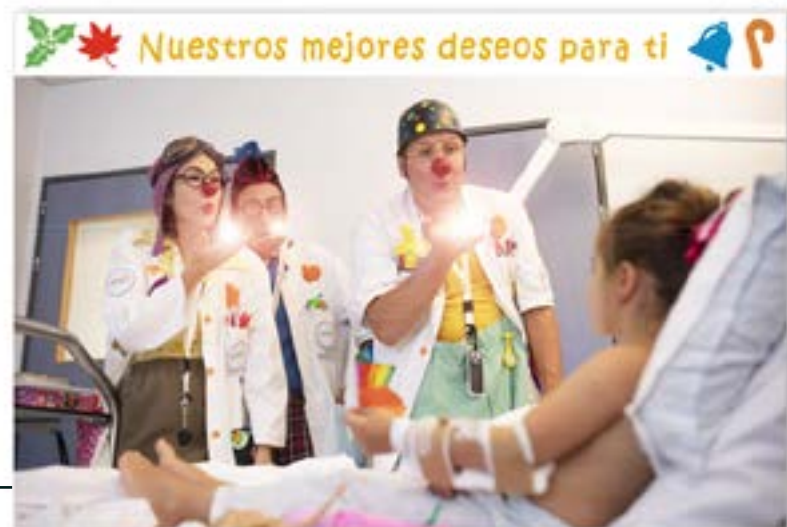
FT18-08 Autor: Fundación Theodora 21x14 cm 1,2€ unidad (sobre incluido)

I.V.A incluido. Gastos de envío no incluidos Realiza tu pedido enviando un e-mail a juan.naranjo@theodora.org Imágenes disponibles en formato digital - Consultar costes de personalización