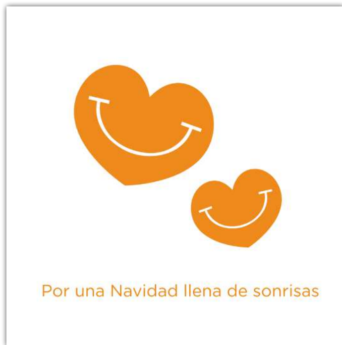
FT19-01 Autor: Fundación Theodora 21x15 cm 1,3€ unidad (sobre incluido)