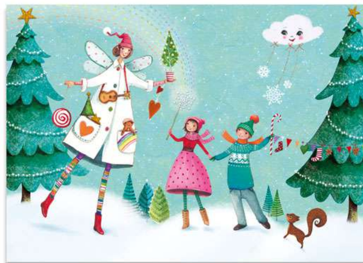
FT19-03 Autor: Mila-Marquis 21x15 cm 1,3€ unidad (sobre incluido)