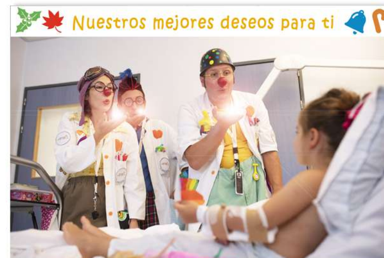
FT19-06 Autor: Fundación Theodora 21x14 cm 1,3€ unidad (sobre incluido)

I.V.A incluido. Gastos de envío no incluidos Imágenes disponibles en formato digital - Consultar costes de personalización