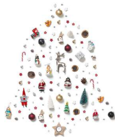
FT19-04 Autor: PierreYves-Massot 15x15 cm 1,3€ unidad (sobre incluido)

I.V.A incluido. Gastos de envío no incluidos Imágenes disponibles en formato digital - Consultar costes de personalización