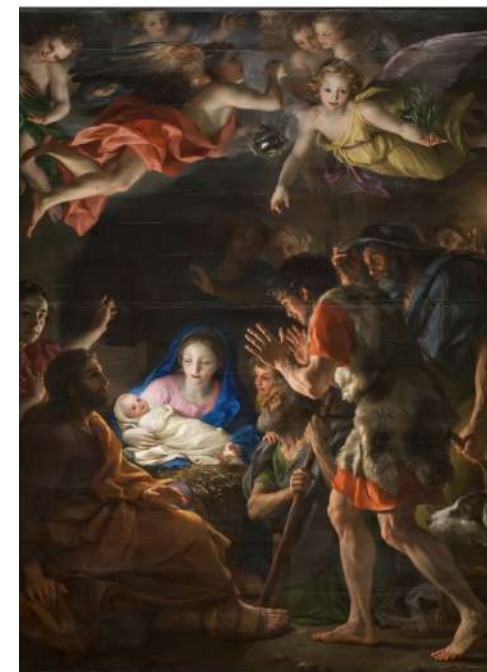
FT19-01 Adoración de los Pastores Autor: Anton Rafael Mengs Museo del Prado, Madrid 21x13 cm 1,3€ unidad (sobre incluido)