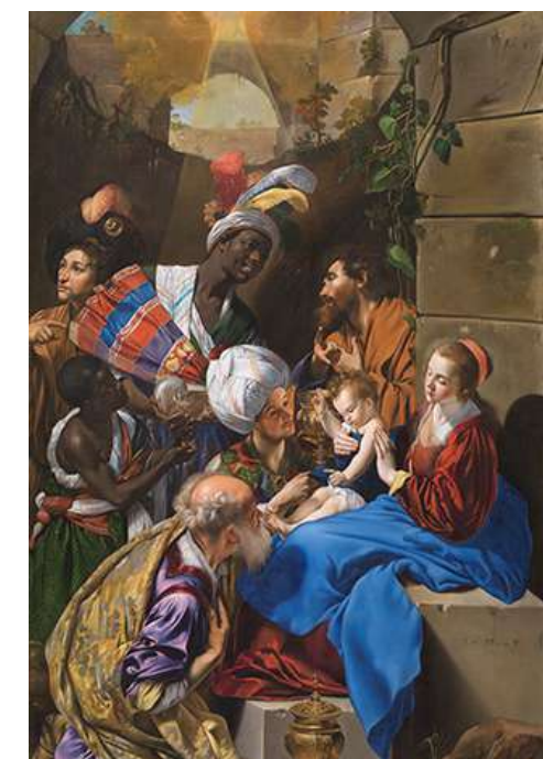
FT19-02 La Adoración de los Reyes Magos Autor: Fray Juan Bautista Maíno Museo del Prado, Madrid 13x21 cm 1,3€ unidad (sobre incluido)

I.V.A incluido. Gastos de envío no incluidos Imágenes disponibles en formato digital - Consultar costes de personalización