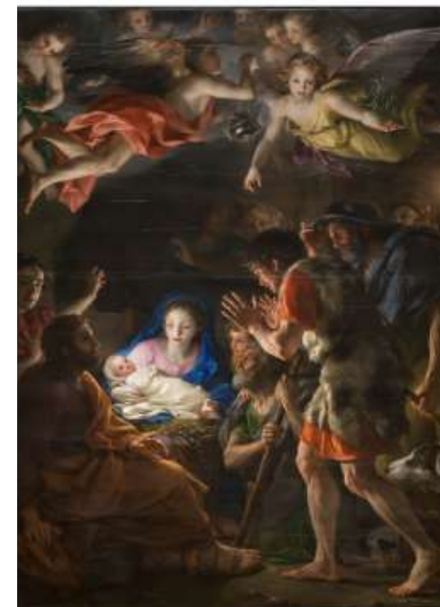
FT19-01 Adoración de los Pastores Autor: Anton Rafael Mengs Museo del Prado, Madrid 21x13 cm 1,3€ unidad (sobre incluido)