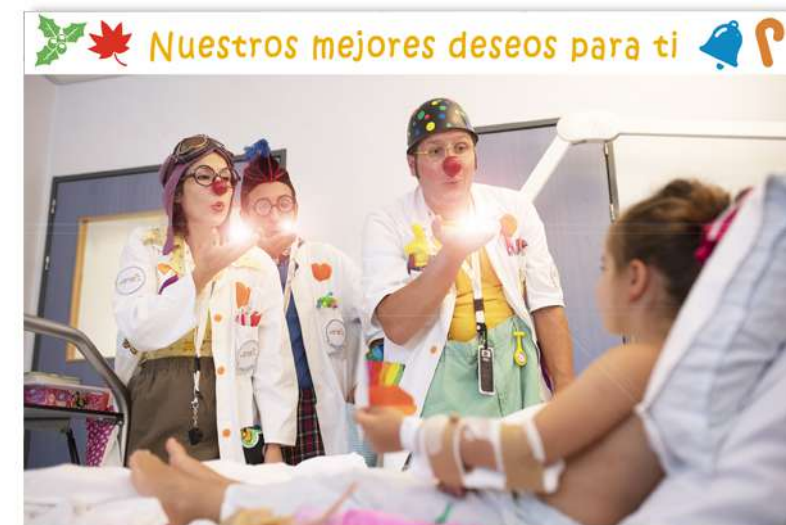
FT19-06 Autor: Fundación Theodora 21x14 cm 1,3€ unidad (sobre incluido)

I.V.A incluido. Gastos de envío no incluidos Imágenes disponibles en formato digital - Consultar costes de personalización