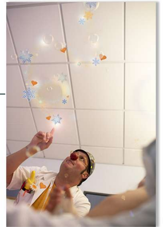
FT19-05 Autor: Fundación Theodora 14x21 cm 1,3€ unidad (sobre incluido)

I.V.A incluido. Gastos de envío no incluidos Imágenes disponibles en formato digital - Consultar costes de personalización