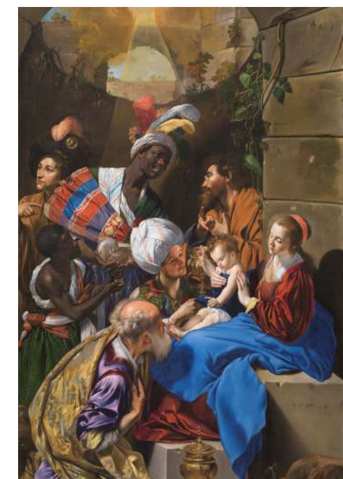
FT19-02 La Adoración de los Reyes Magos Autor: Fray Juan Bautista Maíno Museo del Prado, Madrid 13x21 cm 1,3€ unidad (sobre incluido)

I.V.A incluido. Gastos de envío no incluidos Imágenes disponibles en formato digital - Consultar costes de personalización