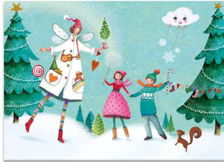
FT19-03 Autor: Mila-Marquis 21x15 cm 1,3€ unidad (sobre incluido)