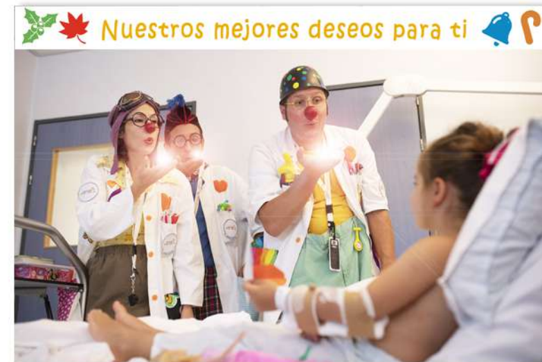
FT19-06 Autor: Fundación Theodora 21x14 cm 1,3€ unidad (sobre incluido)

I.V.A incluido. Gastos de envío no incluidos Imágenes disponibles en formato digital - Consultar costes de personalización