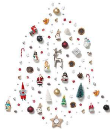
FT19-04 Autor: PierreYves-Massot 15x15 cm 1,3€ unidad (sobre incluido)

I.V.A incluido. Gastos de envío no incluidos Imágenes disponibles en formato digital - Consultar costes de personalización