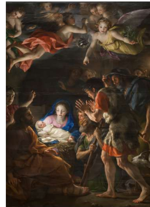
FT19-01 Adoración de los Pastores Autor: Anton Rafael Mengs Museo del Prado, Madrid 21x13 cm 1,3€ unidad (sobre incluido)